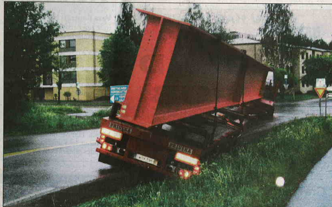
På tisdagskvällen inträffade den här olyckan i korsningen Lumivaaravägen och Gamla Vasagatan.